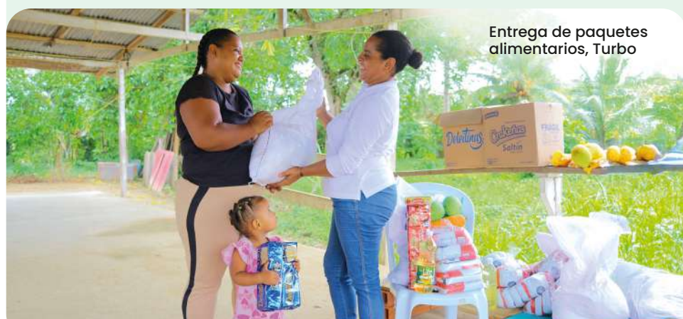
Entrega de paquetes alimentarios, Turbo

Multiplicamos por cinco los recursos del Programa de Alimentación Escolar -PAE: beneficiamos a 312 mil estudiantes durante los 180 días del calendario escolar