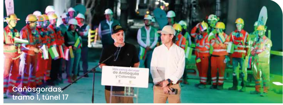
Cañasgordas, tramo 1, túnel 17

nos conectamos con nuestro aeropuerto internacional mediante un puente de doble calzada con dos niveles tipo trébol, pasos peatonales, mobiliario urbano y paisajismo