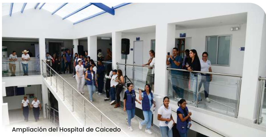
Ampliación del Hospital de Caicedo

Para solventar parte de la crisis financiera de los hospitales, agravada por las decisiones del Gobierno Nacional, invertimos en el saneamiento fiscal de 52 hospitales de Antioquia