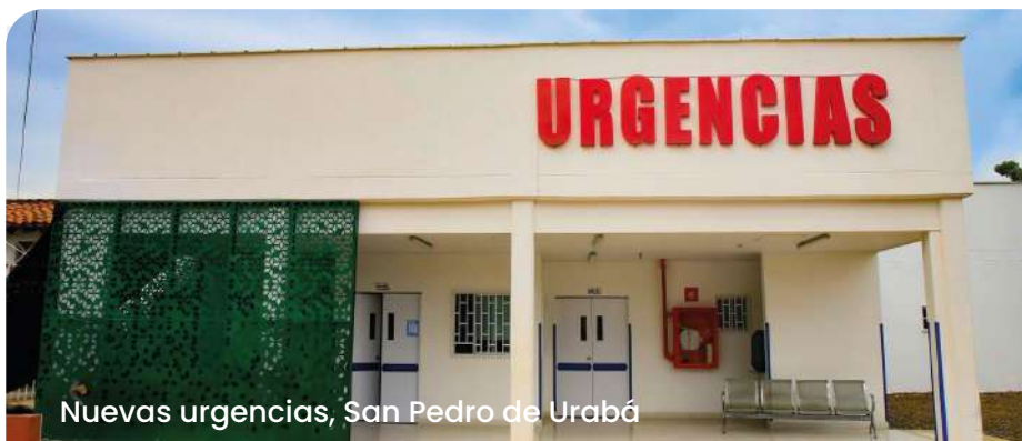
Nuevas urgencias, San Pedro de Urabá

de especialistas en pediatría, psiquiatría, medicina interna, urgenciólogía, obstetricia y toxicología