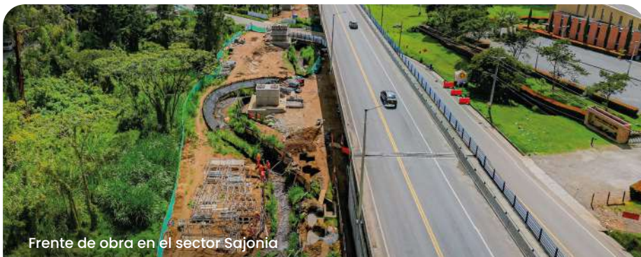
Frente de obra en el sector Sajonia

842 sedes educativas de Antioquia tienen nuevas inversiones en mejoramientos, restaurantes escolares, placas polideportivas y conectividad