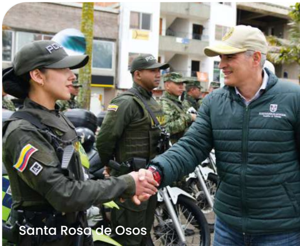
Santa Rosa de Osos

Tasa de Seguridad: iniciamos la intervención de 25 estaciones de Policía y unidades militares que están en pésimas condiciones