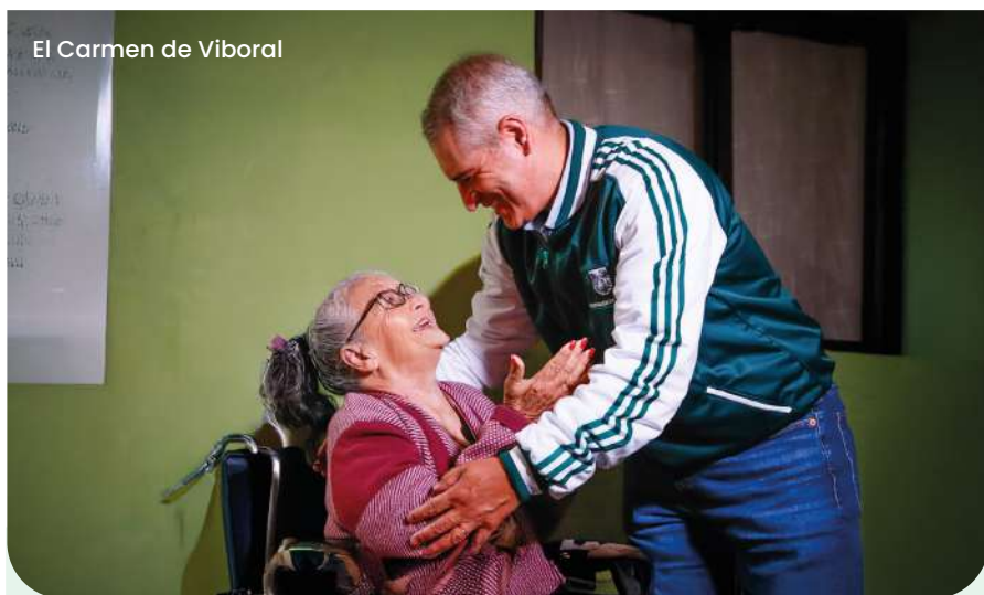
El Carmen de Viboral

Los Antioqueños se conectaron con la causa de disminuir el hambre de sus paisanos más vulnerables por medio del pago del impuesto vehicular