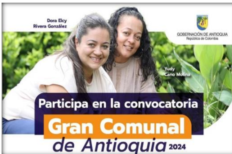
Imagen 5. Convocatoria Pública Gran Comunal de Antioquia 2024