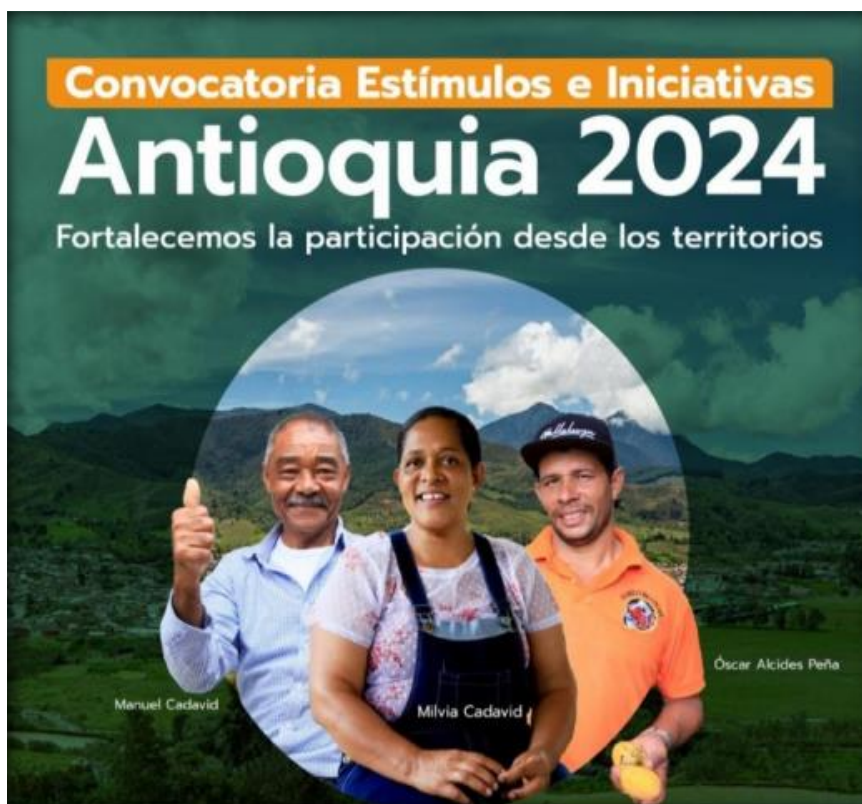
Imagen 4. Convocatoria Pública Estímulos e Iniciativas Antioquia 2024