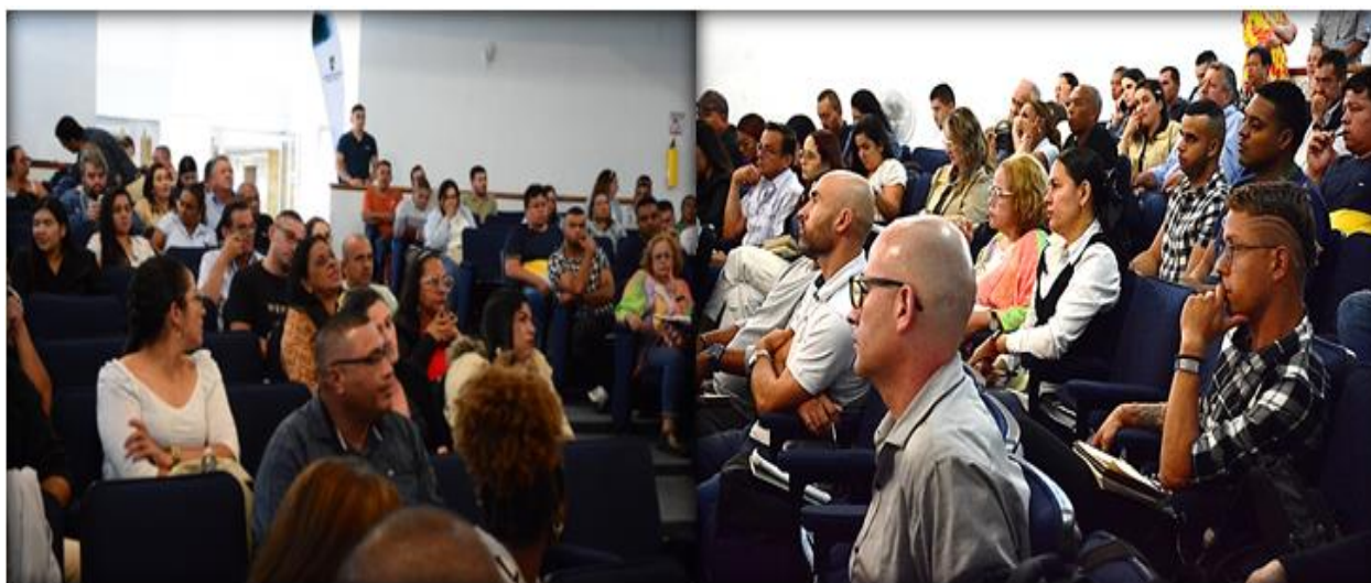
Imagen 3. Encuentro secretarios/promotores de Desarrollo Comunitario. Medellín, junio 2024