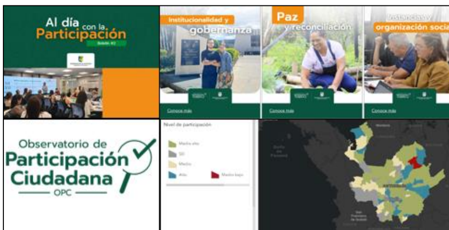
Imagen 9. Observatorio de Participación Ciudadana