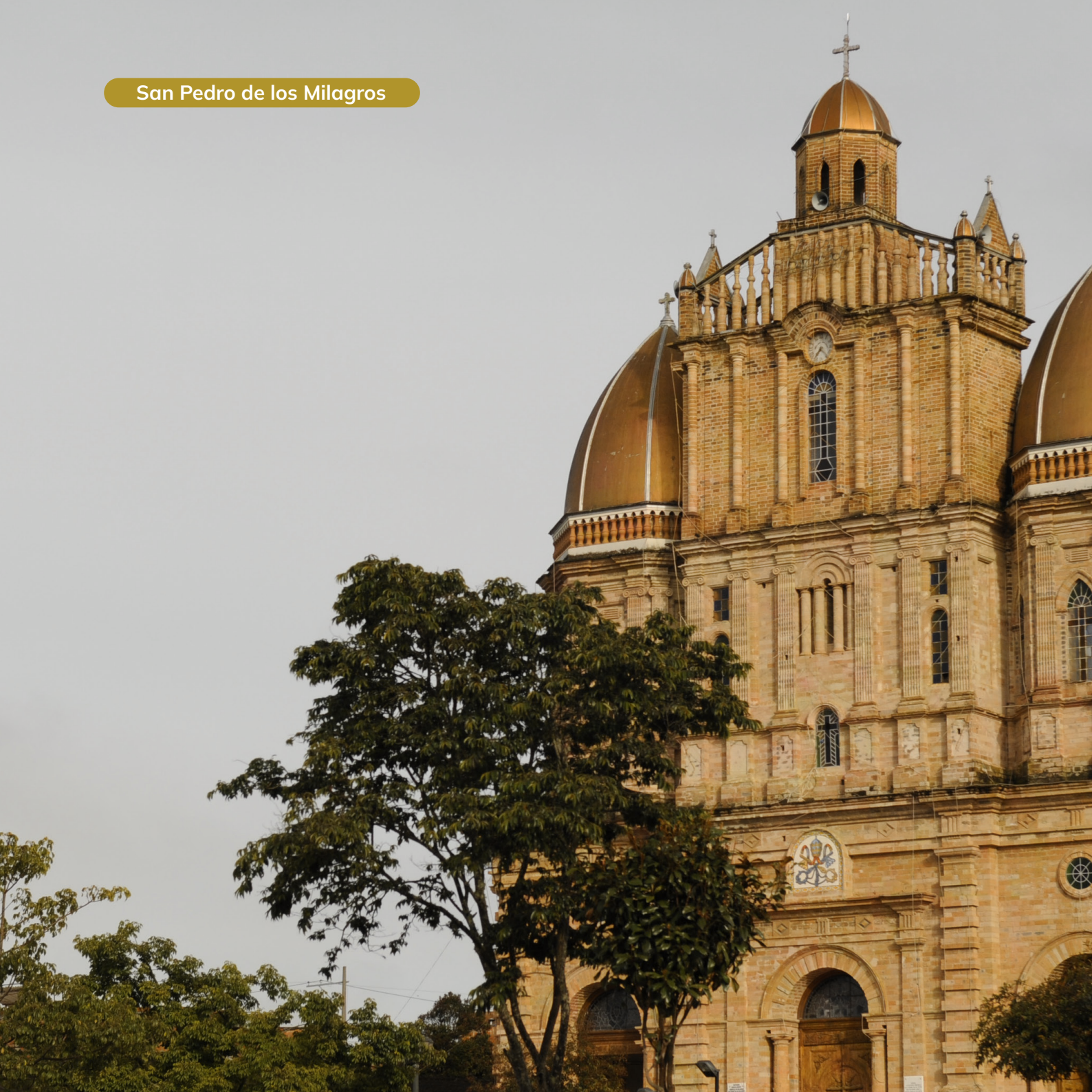
San Pedro de los Milagros