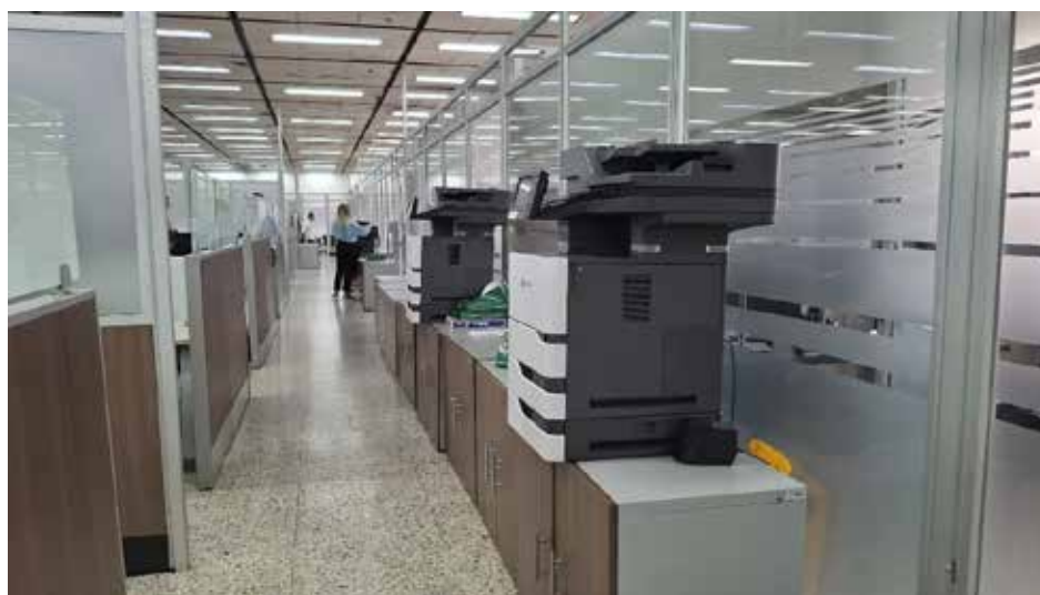
Registro fotográfico 17 Corredor principal con obstáculos en Secretaría de Hacienda año 2023.