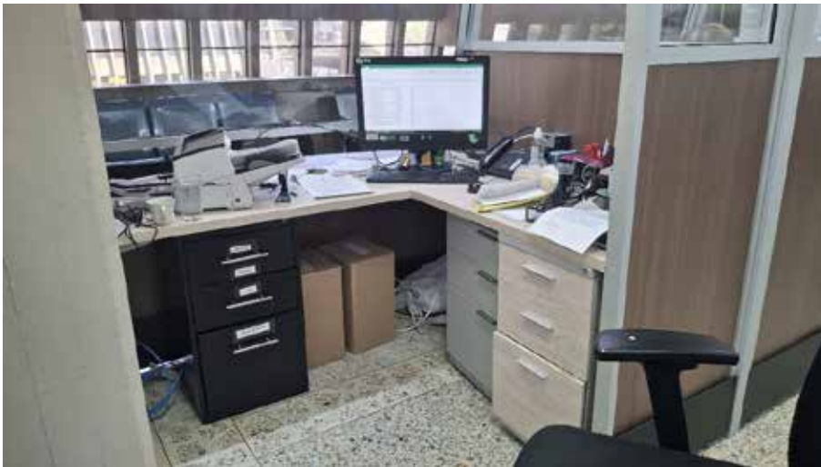
Figura 1: Mueble de almacenamiento credenza