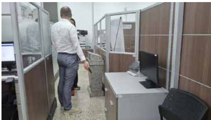
Registrofotográfico 23 Corredor de acceso al costado sur piso 5 reducción de la circulación del pasillo.