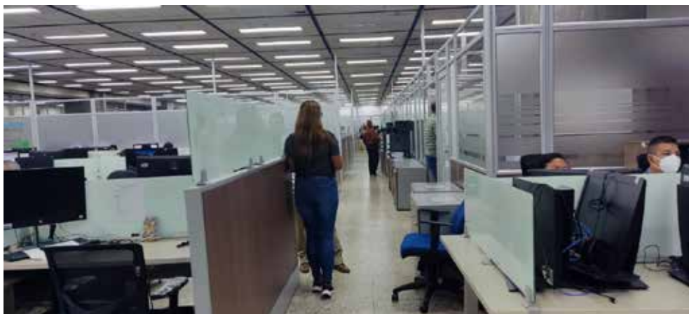
Registro fotográfico 16 Secretaría de Hacienda año 2025