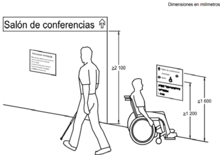
Figura 58. Altura de las señales

Imagen 3 Figura 58 tomada de NTC 6047 Sobre las dimensiones de altura de las señales.