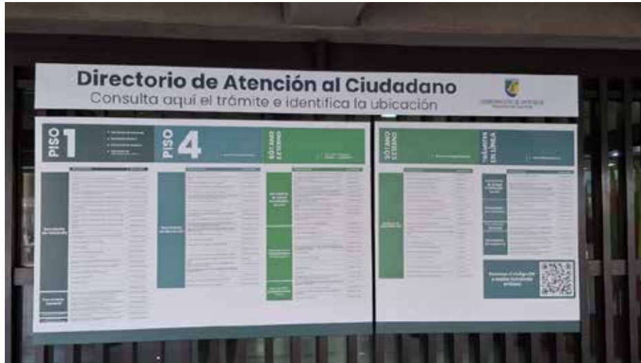
Registro fotográfico 11 y 12: Punto de atención al usuario externo Dirección de Seguridad Vial y local entrega de Pasaportes atención externa, donde prevalecen comunicaciones sin tamaños indicados e inclusivos para toda la información en la vigencia 2025.