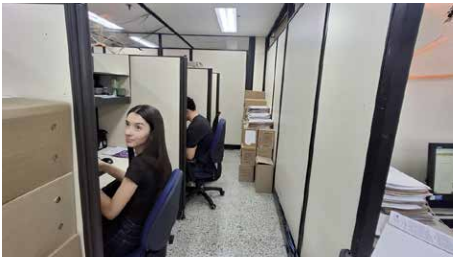
Registro fotográfico 20 Secretaría de Salud e Inclusión Social almacenamiento de expedientes de archivo sobre corredor principal