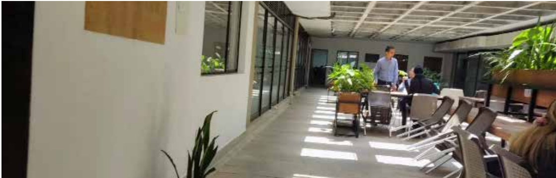
Registro fotográfico 14. Ingreso Principal CAD, no se cuenta con identificación de atención inclusiva y/o demarcación de discapacidad.