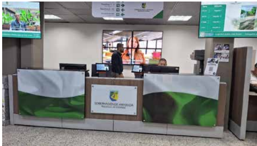
Registro fotográfico 7: Atención remodelada en piso dos costado sur con alturas superiores a las permitidas por accesibilidad según NTC6047 para la atención de usuarios internos y externo.