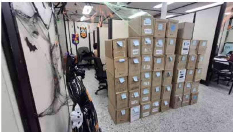
Registro fotográfico 19 Secretaría de Salud e Inclusión Social Circulación pasillos internos con limitación en los extremos del costado norte.