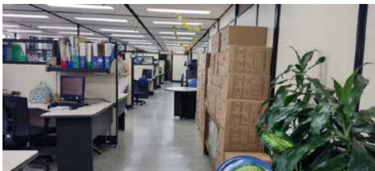
Registro fotográfico 22 Dirección de Pasaportes ubicación de mobiliario sobre pasillos principales.