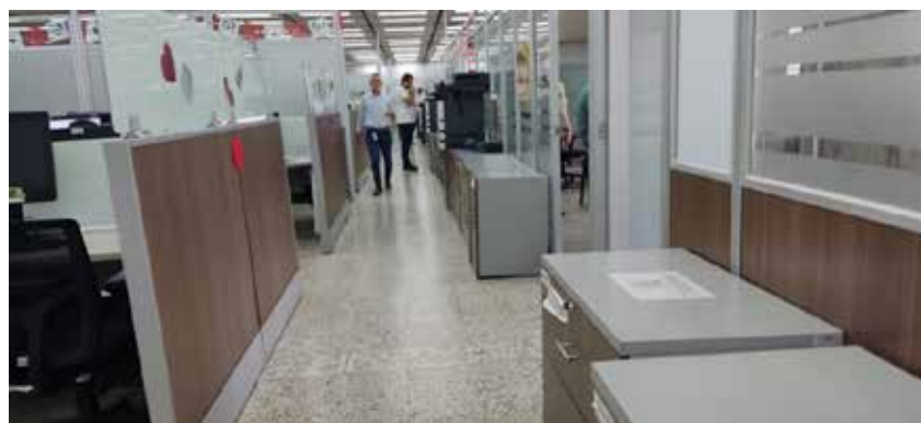
Registro fotográfico 18 Secretaría de Salud e Inclusión Social Circulación principal con obstáculos de muebles.