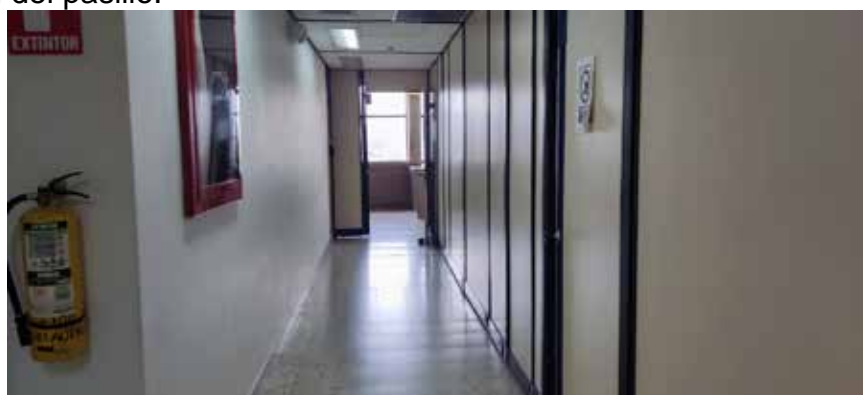
Registrofotográfico 24 Corredor de acceso al costado sur piso 6 reducción de la circulación del pasillo.