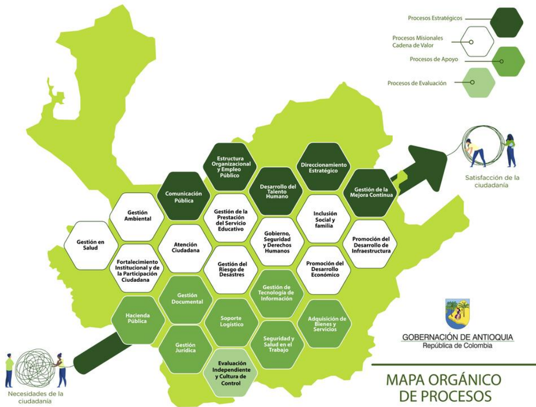
Ilustración 1 Mapa de Procesos Gobernación de Antioquia