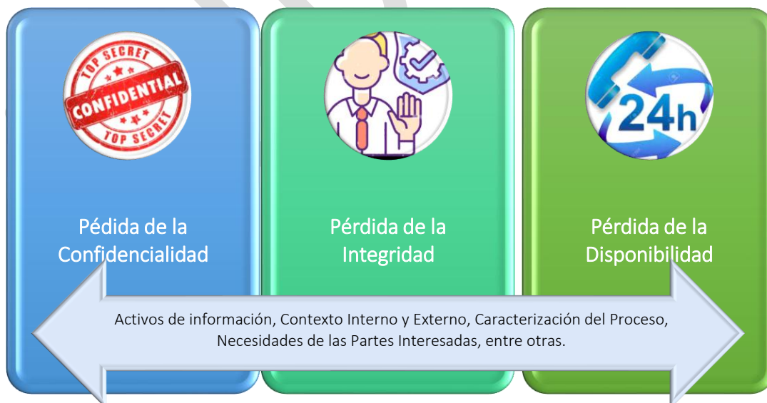
Imagen No.4 – Identificación de riesgos.

Teniendo en cuenta las fuentes de información y las incertidumbres se debe evaluar las amenazas y vulnerabilidades que puedan afectar los activos de información, analizando sus posibles consecuencias y estimando la probabilidad e impacto en la seguridad de la información.