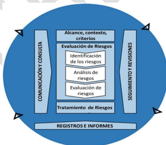
Imagen No.1 – Proceso de Administración y/o Gestión de Riesgo.

Como se ilustra en la siguiente imagen No.1.