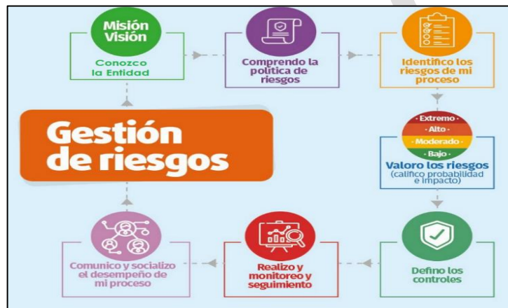
Imagen No.2 – Gestión de riesgo.

Este ciclo detalla la ejecución de las actividades propuestas para asegurar una gestión efectiva y actualizada de los riesgos asociados a la seguridad de la información.