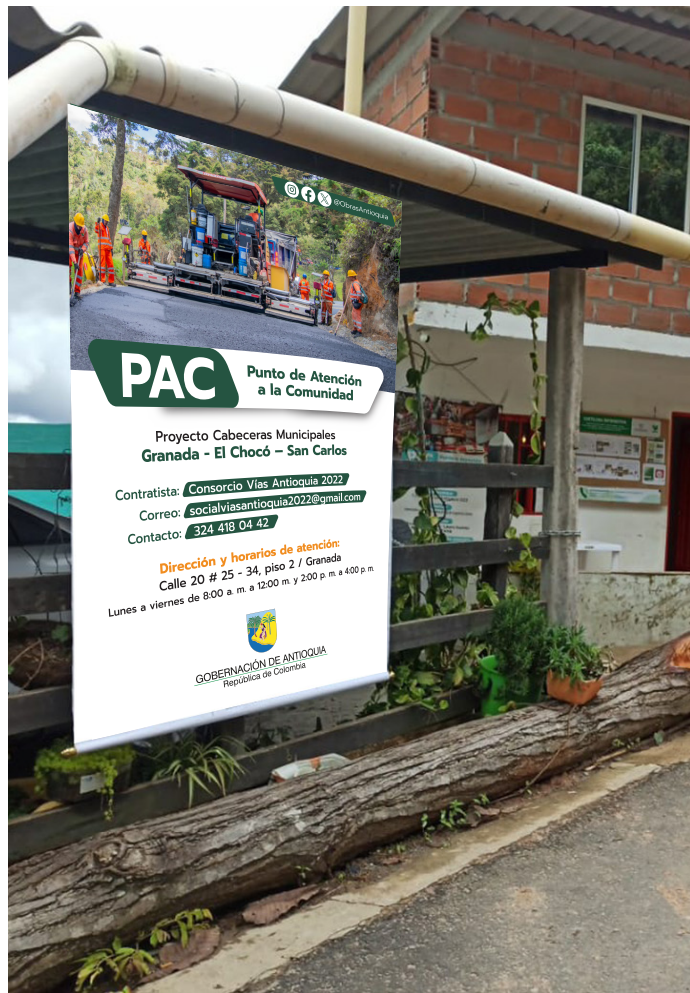
Indicaciones de lugar