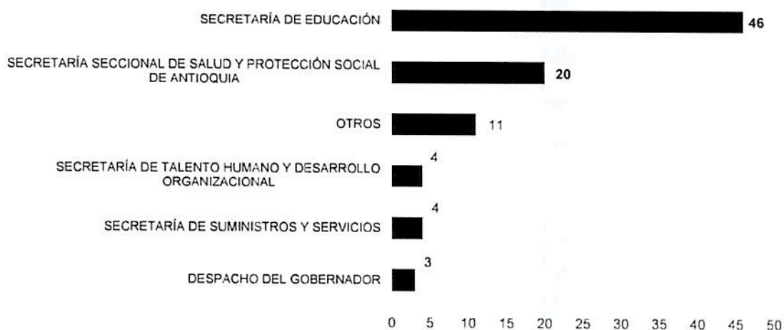
Gráfica 1. Distribución de las vacantes por organismo