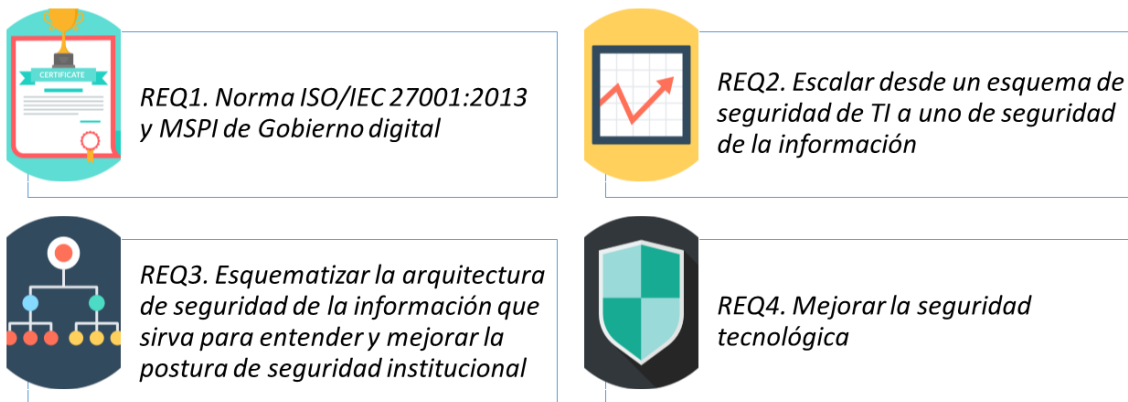
Ilustración 4 -Requerimientos de las partes interesadas