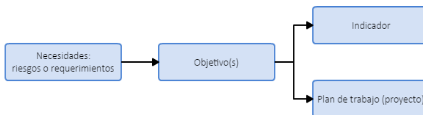
Ilustración 1 - Despliegue esquemático Necesidades de la Entidad

La estrategia presenta el estado actual en lo relacionado a riesgos dentro del alcance del SGSI y el estado planeado al final de su ejecución, está definida con base dos tipos de necesidades de seguridad de la información de la entidad: riesgos y requerimientos (de las partes interesadas). El plan de identificación y tratamiento de riesgos para la de seguridad y privacidad de la información se construyó a través de un despliegue estratégico esquematizado a continuación: