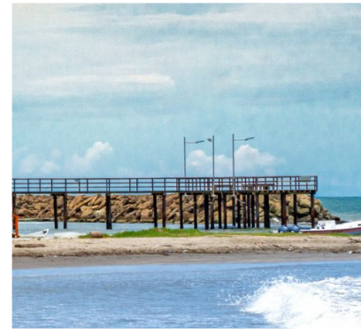
Arboletes - Antioquia